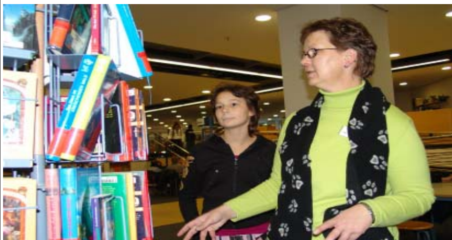
Wer sucht, der findet: In der Bibliothek gibt etwas für jeden.