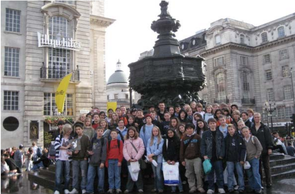
Mitten in der Metropole: Die große Reisegruppe im Herzen der Londoner City