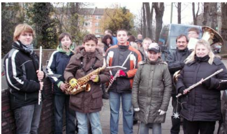
St. Martin, St. Martin: Der Soundexpress vor der Bonifatiuskirche an der Moltkestraße. Mit großer Begleitung der Kleinen aus Schule und Kindergarten ging es für die Musiker dann Richtung Siepental.

Auch dieses Jahr war der „Soundexpress“, die Big Band der Frida-Levy-Gesamtschule, wieder mit dem heiligen Martin durch drei Stadtteile unterwegs und hat mehrere hundert Kinder beim Singen der Martinslieder begleitet. So war die Band in der Gemeinde St. Winfried in Kray, in Stoppenberg mit dem Kindergarten „Wirbelwind“ und der ev. Thomasgemeinde und mit der Winfriedschule und der St. Bonifatius Gemeinde in Huttrop unterwegs. Die Schülerinnen und Schüler wurden mit heißen Getränken und den obligatorischen Brezeln belohnt. Drei Zeitungsartikel widmeten sich dem Engagement unserer MusikerInnen!