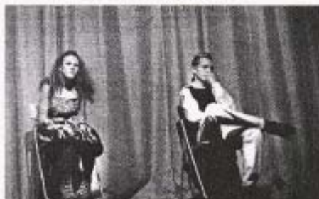
Ohne Requisiten schauspielern Schüler des achten Jahrgangs beim Sprechtheater in der ehemaligen Humboldt Aula.

Das Publikum ist von den Darstellungen der Jungschauspieler begeistert: Es klatscht, pfeift und jubelt oder leidet mit dem Akteuren und freut sich auf die Fortsetzung der Stücke beim nächsten Theaterabend. So aber bleibt zunächst am Ende „der Vorhang zu und alle Fragen offen“.